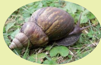
アフリカマイマイ