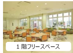
1階フリースペース

1階フリースペースでは、飲食も可能ですので近くの商店街でお買い物でもして、ゆっくり休憩しながら旅の計画を立ててみては? また島の方もたくさん利用されていますので交流が生まれるかもしれません。