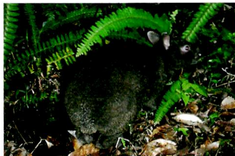
アマミノクロウサギ

国指定特別天然記念物の「アマミノクロウサギ」をはじめ、奄美固有の動植物が生息し、今なお、独自の生態系と太古の様相をとどめていることから、世界自然遺産登録候補地となっています。